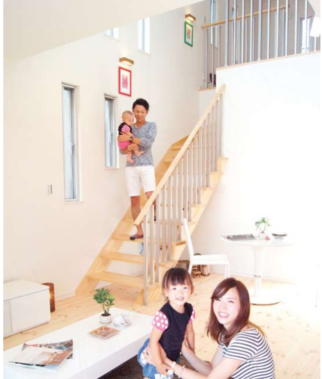
床には無垢のバイン材、壁に珪藻土クロスを使用し、自然素材の温もりある空間となったLDK。上部に見える吹抜けは室内に光を届けるだけでなく、1階と2階を繋ぐ役割も果たし、違うフロアにおいても家族の気配が常に感じられる設計に（見開き頁の写真は全て松田モデルハウス）