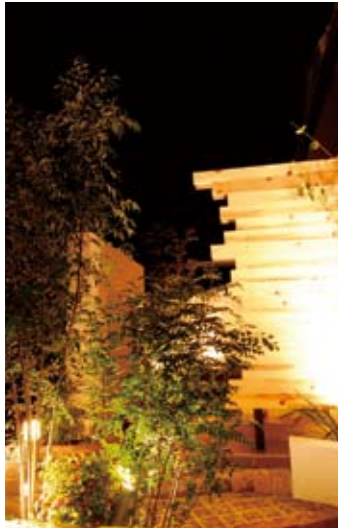
夜も、植栽と間接照明で雰囲気演出するプライベートガーデンのアプローチ