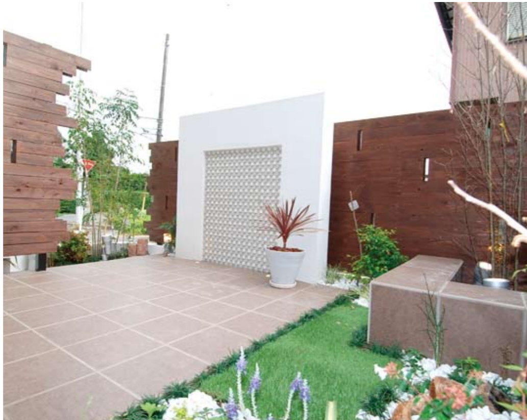
周囲を気にせず、家族とバーベキューなどを思いっきり楽しめる広々プライベートガーデン。「ただ住宅性能の高い家をリーズナブルにつくる」のではなく、じっくりと施主と向き合い、ライフスタイルに合わせた「住まい方」を提案しているからこそ生まれた空間だ

予算 95%が1000万円台で夢を叶えます！ お手頃価格と聞いていたけど、いざ行って話を聞いてみると「あれ？思っていたより高いな…」という経験をしたことがないだろうか？ 同社では、そんな「行ってガッカリ」ということがないよう、2013年の建築実績（38棟）の価格帯を公開。結果、