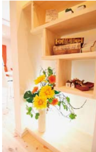
ゲストを迎えるディスプレイ棚は、「自分らしい空間」を造りこむことができる

モデルハウス 不安を希望に変える松田モデルハウス 「価格がリーズナブルだと、色々不安…」というのは本音だろう。そこで同社では、住性能を体感できるモデルハウスを用意。「想像を良い意味で裏切ってくれました！」と訪れた人の声もあり、抱いている不安をきくと希望へ変えてくれるだろう。ぜひ一度訪れよう。