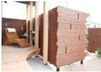
休日、読書しながらティータイムを満喫できる緑側（ENGAWA）＋ウッドデッキも設えた