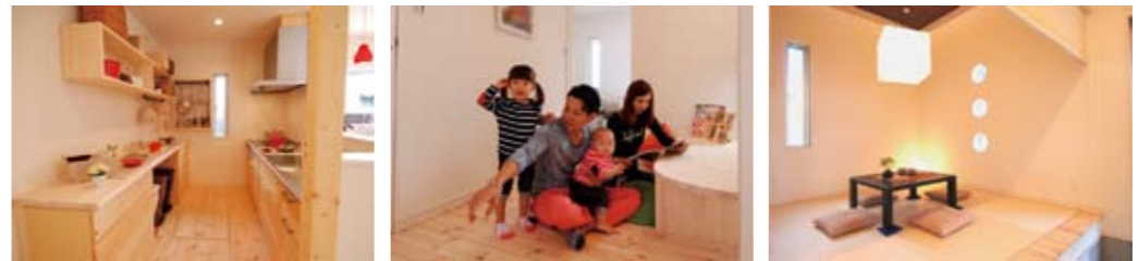
キッチン、無垢のバイン材で収納棚とカウンターを造作。片づけも楽々で実用性◎ リビングから目の届く所へ机を造作。パパ・ママと一緒に勉強できるスタディスペースに 和室の3つの丸窓は、季節の移り変わりを伝える花木を鑑賞でき、ゆっくり寛げる空間へ