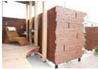
休日、読書しながらティータイムを満喫できる緑側（ENGAWA）+ウッドデッキも設えた