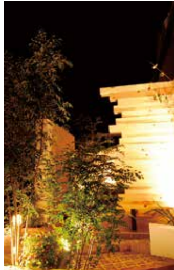
夜も、植栽と間接照明で雰囲気演出するプライベートガーデンのアプローチ