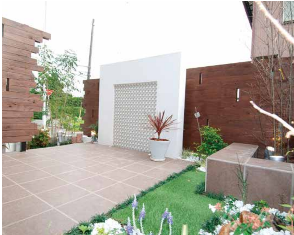
周囲を気にせず、家族とバーベキューなどを思いっきり楽しめる広々プライベートガーデン。「ただ住宅性能の高い家をリーズナブルにつくる」のではなく、じっくりと施主と向き合い、ライフスタイルに合わせた「住まい方」を提案しているからこそ生まれた空間だ

予算 95%が1000万円台で夢を叶えます！ お手頃価格と聞いていたけど、いざ行って話を聞いてみると「あれ？思っていたより高いな…」という経験をしたことがないだろうか？ 同社では、そんな「行ってガッカリ」ということがないよう、2013年の建築実績（38棟）の価格帯を公開。結果、