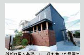
外観は黒を基調にし、落ち着いた雰囲気のスタイリッシュなデザインに仕上げた

モデルハウス 不安を希望に変える松田モデルハウス 「価格がリーズナブルだと、色々不安…」というのは本音だろう。そこで同社では、住性能を体感できるモデルハウスを用意。「想像を良い意味で裏切ってくれました！」と訪れた人の声もあり、抱いている不安をききと希望へ変えてくれるだろう。ぜひ一度訪れよう。