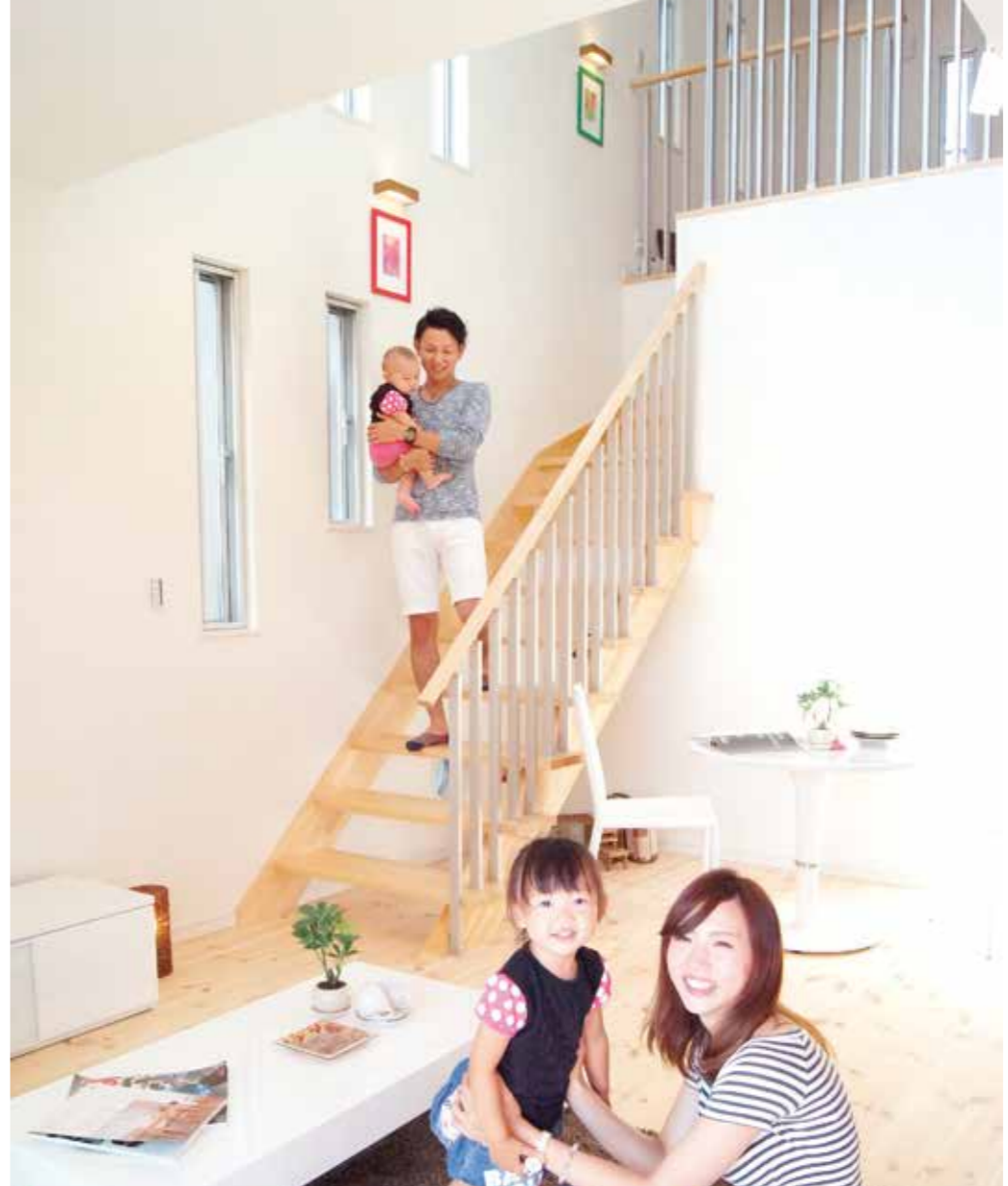
床には無垢のバイン材、壁に珪藻土クロスを使用し、自然素材の温もりある空間となったLDK。上部に見える吹抜けは室内に光を届けるだけでなく、1階と2階を繋ぐ役割も果たし、違うフロアにおいても家族の気配が常に感じられる設計に（見開き頁の写真は全て松田モデルハウス）