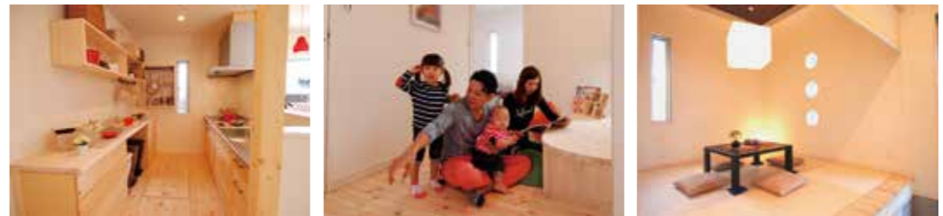
キッチン、無垢のバイン材で収納棚とカウンターを造作。片づけも楽々で実用性◎ リビングから目の届く所へ机を造作。パパ・ママと一緒に勉強できるスタディスペースに 和室の3つの丸窓は、季節の移り変わりを伝える花木を鑑賞でき、ゆっくり寛げる空間へ